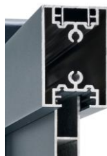
Joints anti-bruits invisibles