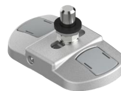
Pivot de sol à visser, réglage 3D