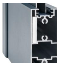
Renfort de motorisation