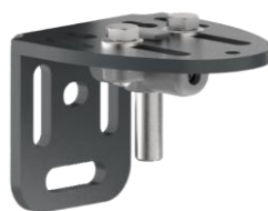
Gond platine laqué, vis à pas métrique (-20 / +10mm)